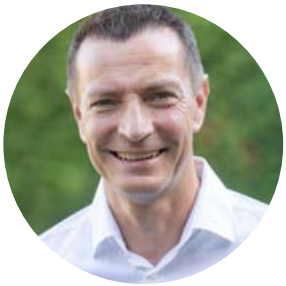
VORWORT Bürgermeister Harald Hahn

Anfang September ist die PV-Anlage auf der Kipp fertiggestellt worden und seit der Inbetriebnahme im Oktober wird dort der Jahresbedarf von 2.400 Haushalten an Strom erzeugt. Das ist mehr als der doppelte Zillingdorfer Stromverbrauch. Das Grün unter den Paneelen wird mit Schafen beweidet, so passiert eine Mehrfachnutzung der vorhandenen Flächen. Gegen Jahresende haben wir noch die Zufahrt bis zu unserem Wasserreservoir, Grünschnittplatz, Hundewiese und Photovoltaik neu asphaltiert. Die „Kipp“ kann jetzt wieder fußläufig umrundet werden.