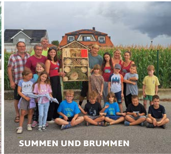
SUMMEN UND BRUMMEN