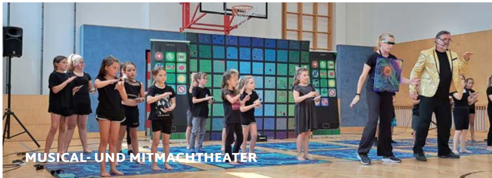
MUSICAL- UND MITMACHTHEATER